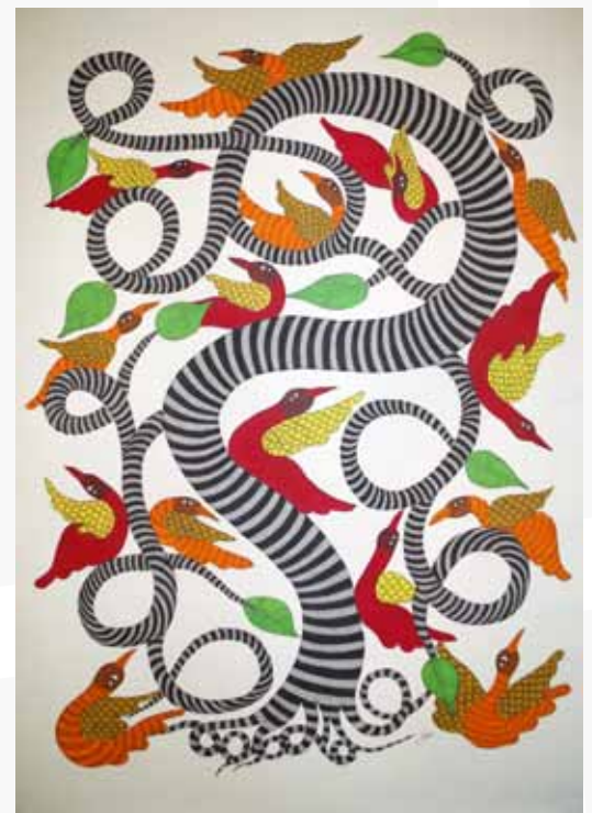
Japni Shyam, acrylique sur toile, 122 x 90 cm