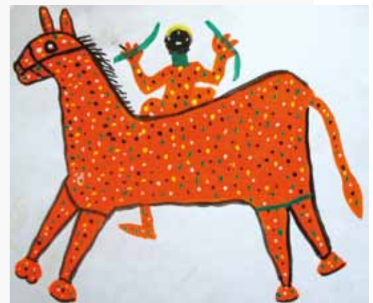
Ladoo Bai, gouache sur papier, 35 x 28 cm