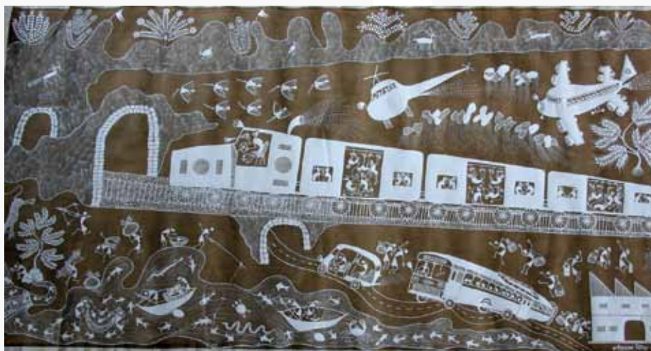
Shantaram Chintya Tumbada, Singes essayant le premier train passant par le pays Warli, Acrylique et bouse de vache sur toile, 176 x 92 cm