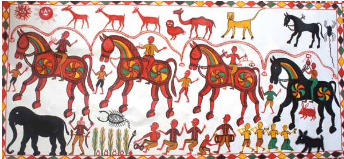
Artiste Bhil Pithora , acrylique sur toile, 143 x 76 cm

Catalogue et visuels en HD disponibles sur demande.