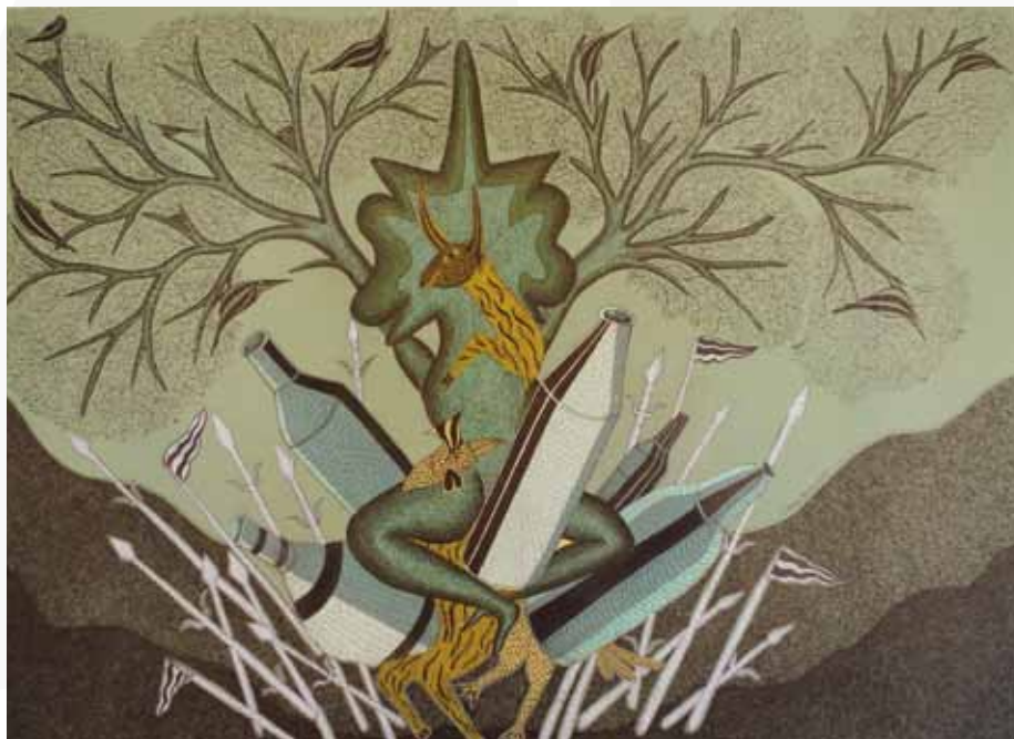
Mayank Shyam, acrylique sur toile, 120 x 91 cm

Contact presse et partenaires : Lucas Chevalier 06 60 68 45 96